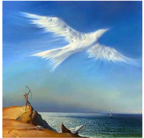
Рис.1 Рис. 2