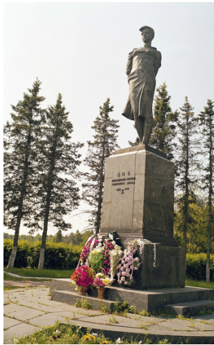
«Зое, бессмертной героине советского народа»

Против нас полки сосредоточив, Враг напал на мирную страну. Белой ночью, самой белой ночью Начал эту чёрную войну!