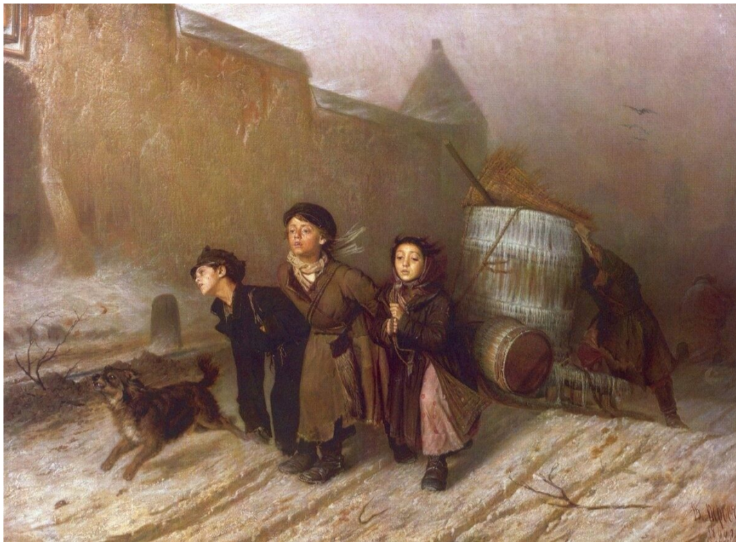
В. Перов. «Тройка»

Рассмотрите иллюстрацию картины В. Перова «Тройка».